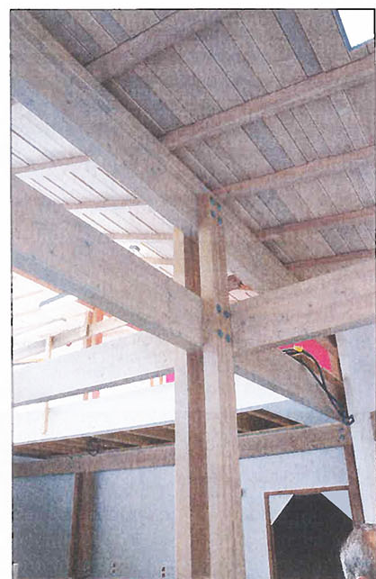
Maison du vélo in Epinal: Buchen-BSH als elegante Mittelstütze

Tannen und Fichten die kleinen Berge, aber das hängt auch viel mit den Aufforstungen nach dem Krieg zusammen. Dort, wo der Staatswald ONF einen natürlichen Nachwuchs bevorzugt, kommt auch an den steileren Hängen der Vogesen Mischwald zutage.