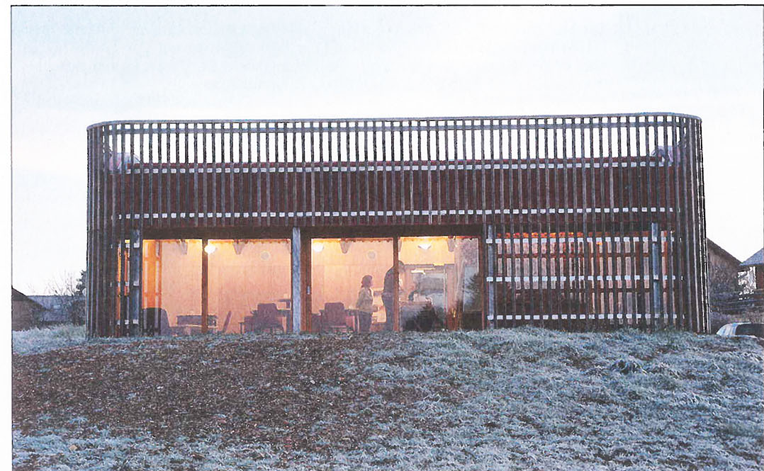
Eins der sechs „Woodies“ auf dem Freizeitgelände in Xertigny